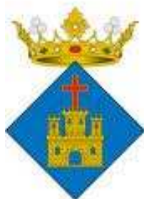
Ajuntament de Cassús