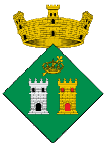
Ajuntament de Sant Joan de Vilatorrada