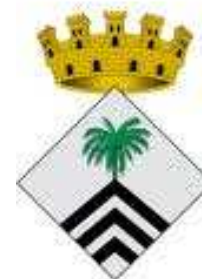
Ajuntament de Súria